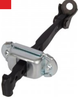
Oe Ref: 72380 TBA A01 KAPI GERGİSİ CIVIC 10 ( 2017- ) ÖN SAĞ , ÖN SOL