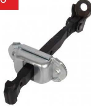
Oe Ref: 72840 TBA A01 KAPI GERGİSİ CIVIC 10 ( 2017- ) ARKA SAĞ , ARKA SOL